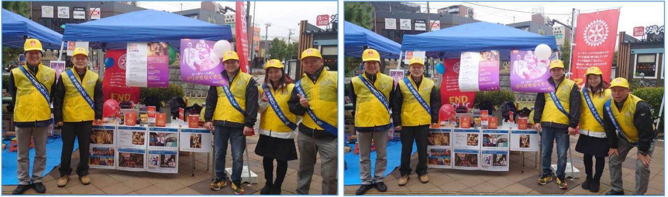
「平塚市民センターまつり」に「END POLIO NOW」のブースを出展し、募金活動を行いました。