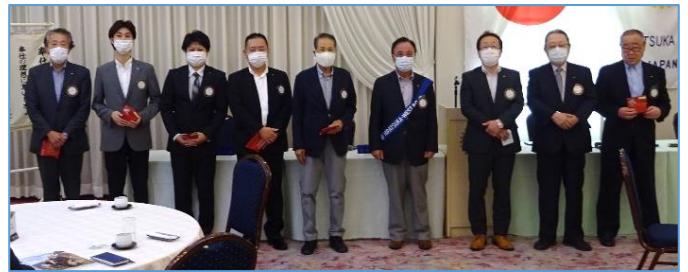
1年間お疲れ様でした