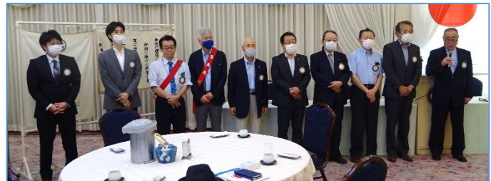
今年度役員の皆様よろしくお祈りします