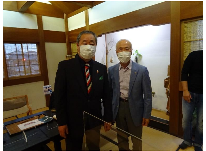
20年連続皆出席の成田会員