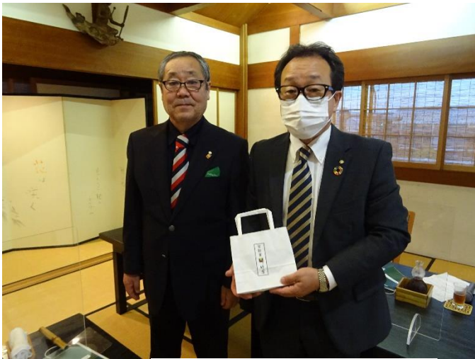
皆出席の伊藤会員