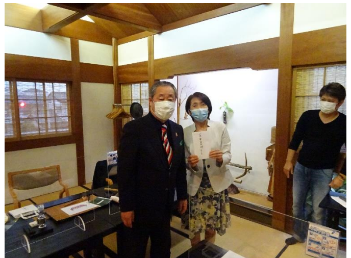
事務局 10年勤続表彰